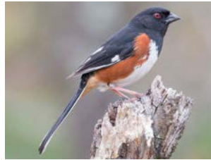
Towhee del este (masculino)